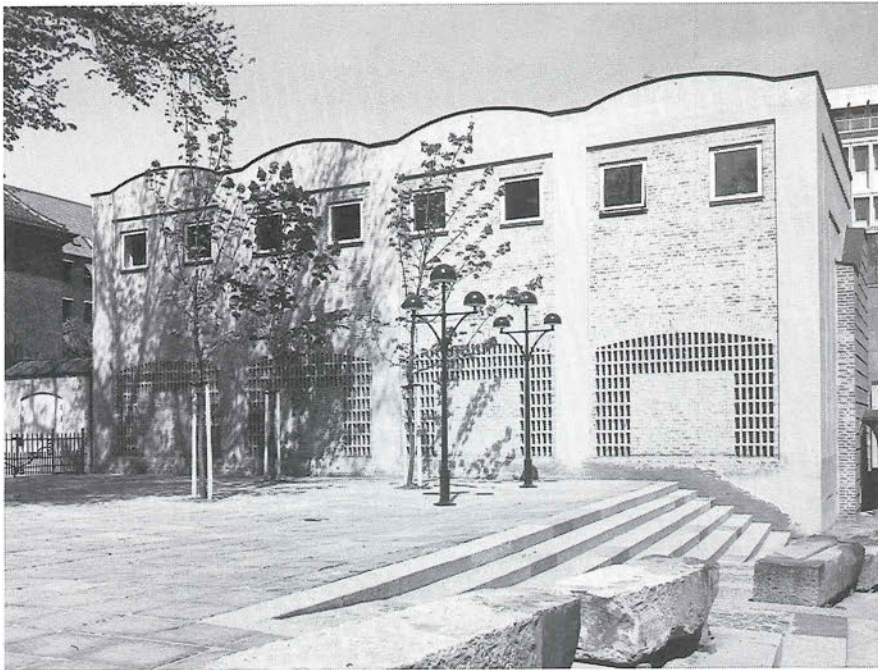
1. Facade mod syd.

2. Menighedshuset set fra præstegårdens have. Karakteristisk er det dekorativt anvendte murværk.