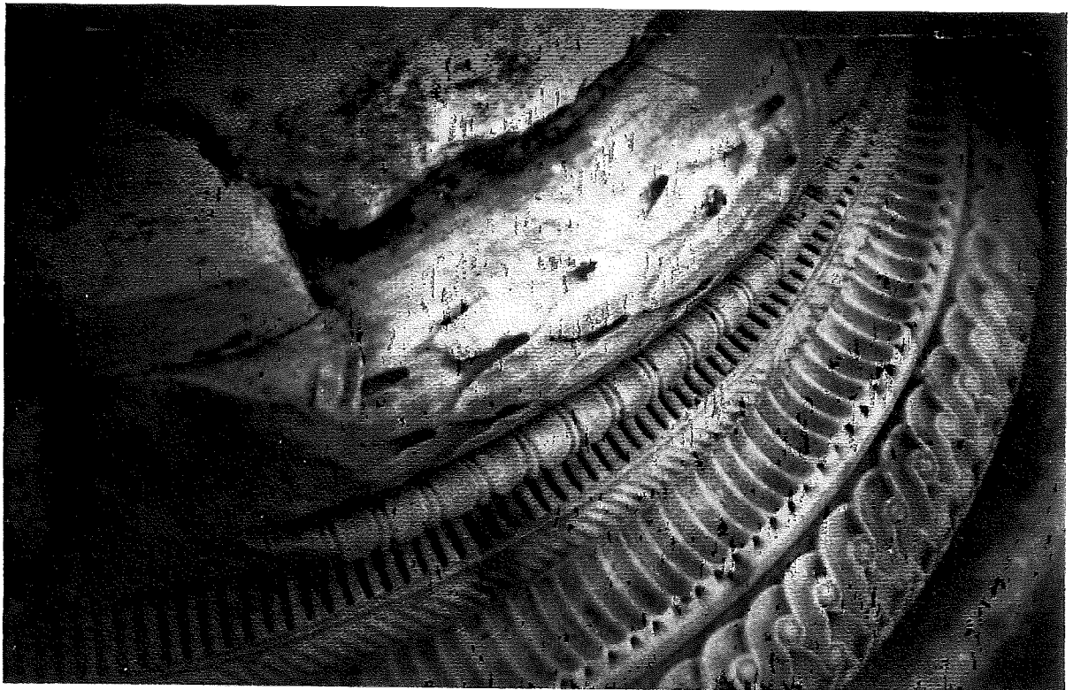
Billedern artiklen Lindhe o af en fot Rom, 199